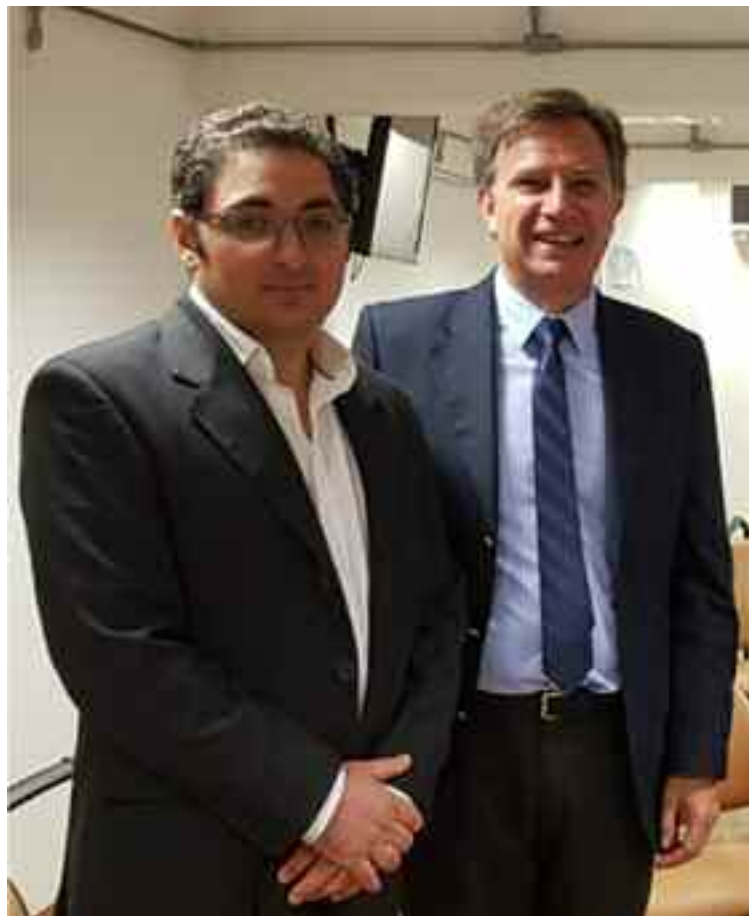
URSS y luego Rusia (1988-1993); jefe de Secretaría de la Dirección general de Asun-