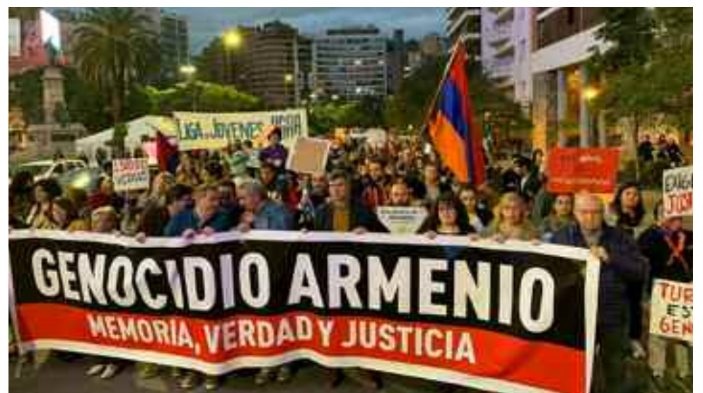
La semana de conmemoración se inició en Córdoba con la marcha de reclamo, el domingo 21 del corriente.