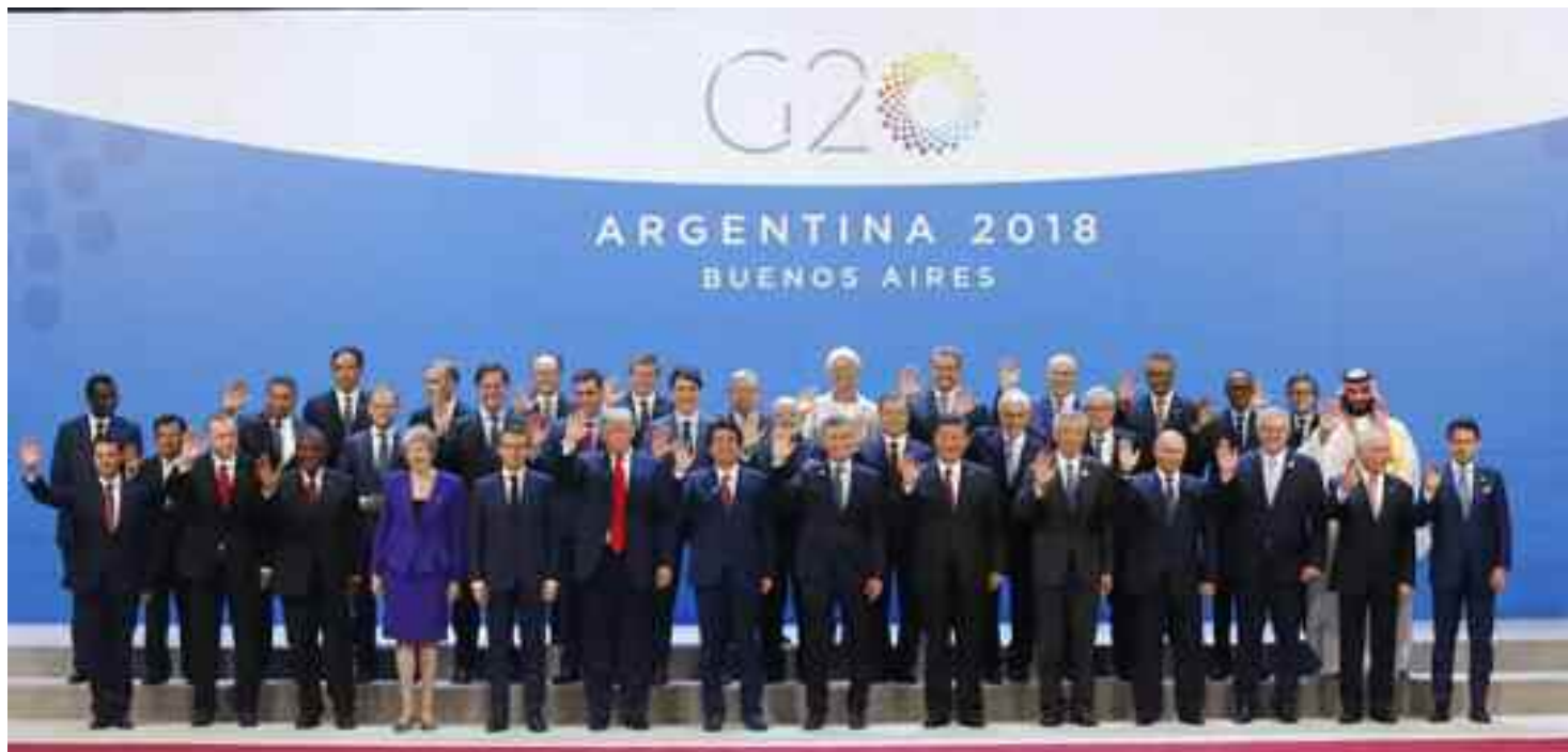
La foto de familia de la cumbre del Grupo de los 20, en Buenos Aires.

El tema del genocidio debemos dejarlo a los historiadores. Ellos tienen que