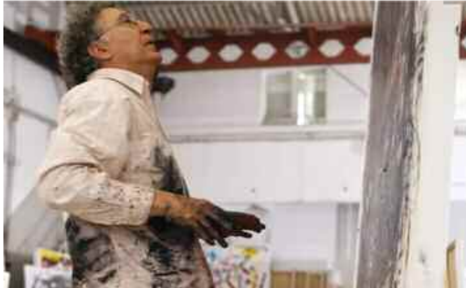
Retrato del artista en acción, por Eugenio Mazzinghi.

profesor de pintura en la Escuela Nacional de Bellas Arts Prilidiano Pueyrredón y, años después, como profesor en Artes Visuales egresado de IUNA (hoy Universidad Nacional de las Artes). Es decir que, finalmente, cumplió con el deseo de los padres. Pero nunca dio clases. “La única forma de comunicar que encontré es la pintura”, dice.