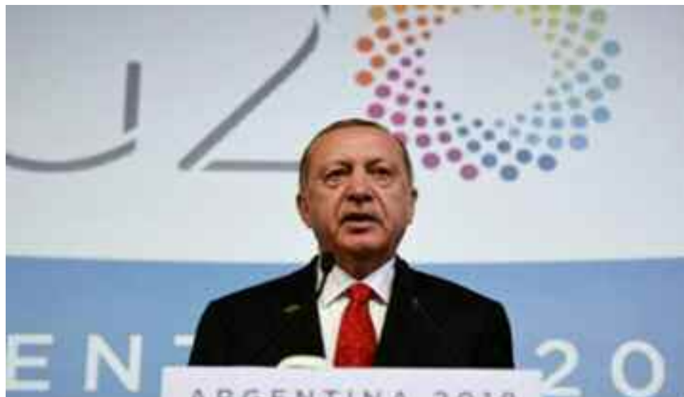
Arriba, Erdogan. Abajo, el periodista que lo incomodó con su pregunta.

Evidentemente, una ofensa también para el Estado argentino.