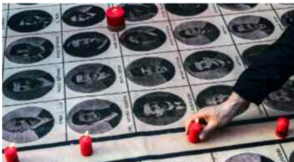
Imágenes que se repiten todos los años en Turquía, en conmemoración del 24 de abril, frente a la estación de tren desde donde fueron llevados los intelectuales armenios antes de su ejecución.

Turquía nunca ha reconocido oficialmente que los actos que llevaron a la muerte de cientos de miles de armenios a partir de 1915 constituyen un genocidio, aunque muchos otros países sí lo hacen.