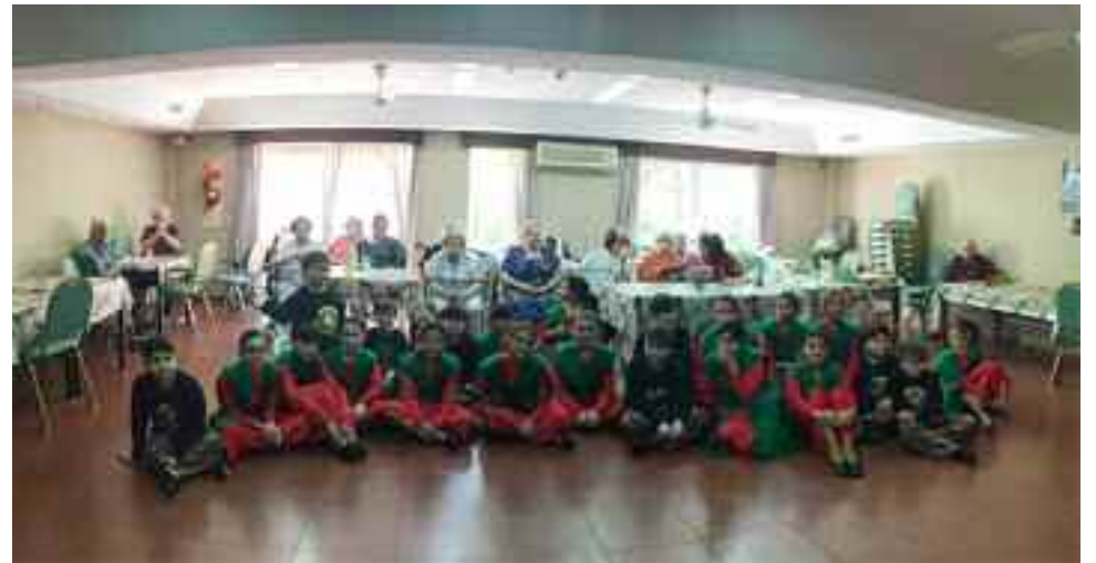
Con los abuelos y bailando para ellos.