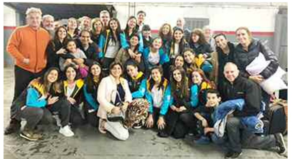
Las chicas y sus familias, antes de la partida.

Los socios para incorporarse a la Asamblea deberán estar al día con Tesorería.