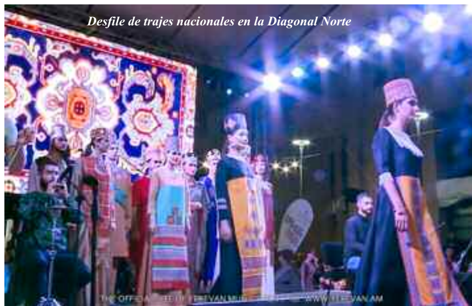
Desfile de trajes nacionales en la Diagonal Norte

nal, titulado “De Urardú a nuestros días”, que asombró al público por la novedad y la diversidad de diseños con estilo armenio.