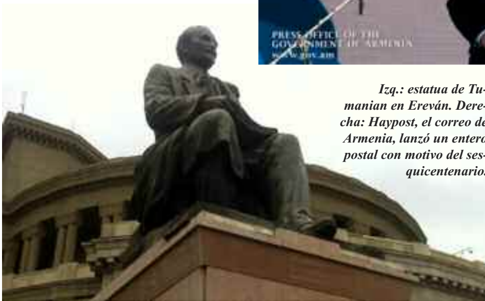
Izq.: estatua de Tumanian en Ereván. Derecha: Haypost, el correo de Armenia, lanzó un entero postal con motivo del sesquicentenario.

Pese a las epidemias, contagios y el sinúmero de muertes naturales, Tumanian no dudó en atender uno a uno a cada huérfano, como si fueran sus propios hijos. De allí y por ello, recibió el apodo de “poeta de todos los armenios” o “poeta patriarca de