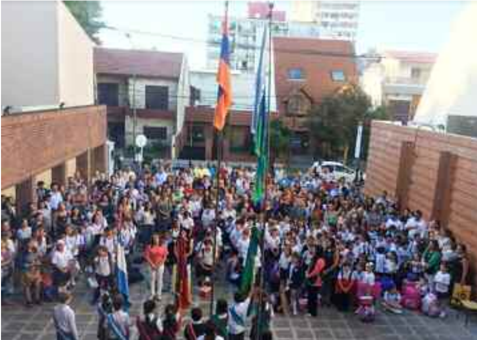
Vista parcial de los presentes en el acto de inicio de las clases.

Ante la presencia de alumnos, padres y familiares, docentes, directivos, comisión directiva, el miércoles 6 de marzo a las 8 se realizó el acto de apertura del ciclo lectivo 2019.