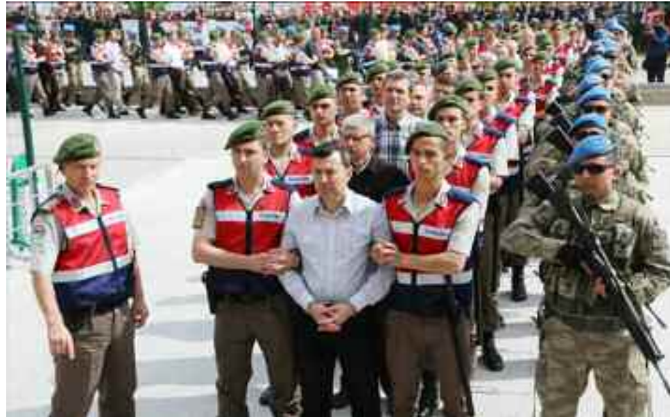
Soldados turcos acusados de participar en intento de golpe en el 2016 llegan al tribunal en 2017 (Adem Altan/Agence France-Presse — Getty Images).

también ha sido acusado en los casos más prominentes enfocados en las altas filas de los golpistas, pero las autoridades estadounidenses dicen que la evidencia presentada es insuficiente para su extradición.