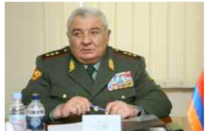
El exsecretario general de la OTSC, Iuri Khachaturov, debió regresar a Armenia, acusado por los hechos de represión de las manifestaciones populares de 2008.

julio. El ministro de Relaciones Exteriores ruso, Sergey Lavrov, denunció que el proceso penal tenía motivación política. Y un funcionario del Kremlin sostuvo que el caso criminal abierto contra el entonces secretario general de la OTSC ha asestado un "golpe colosal a la imagen de toda la orga-