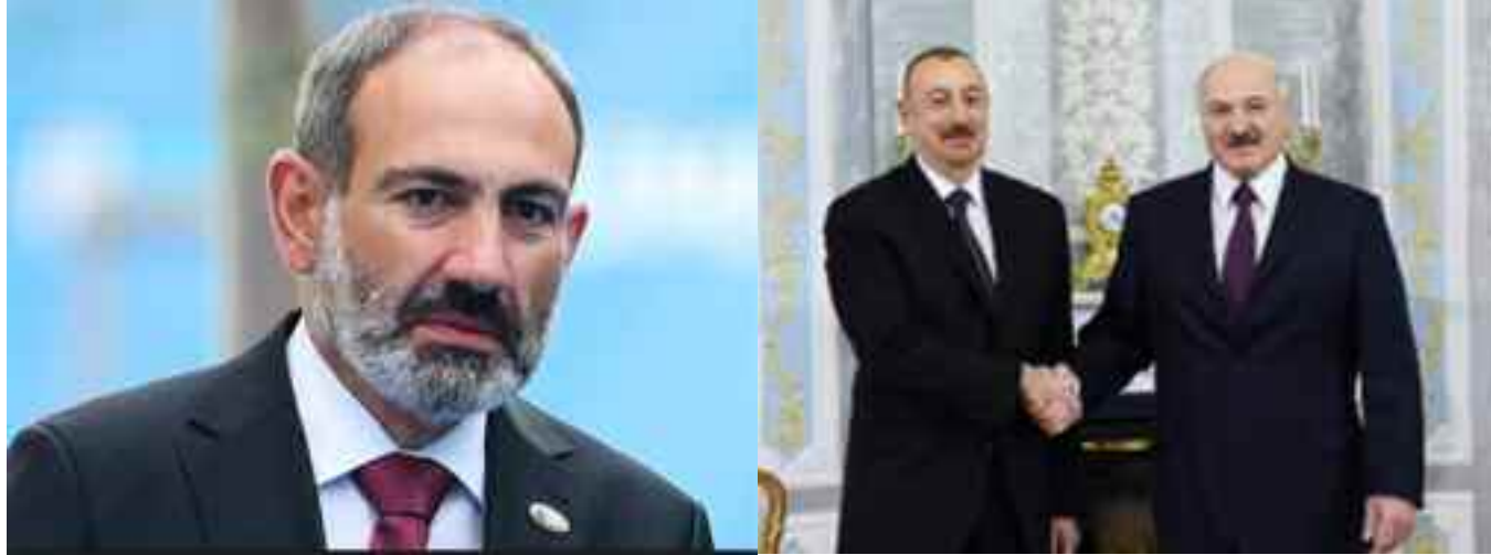
El primer ministro de Armenia, Nikol Pashinian

Ante la vacancia del cargo, el gobierno armenio está tratando de instalar otro secretario general armenio que prestaría servicios hasta 2020. Sin embargo, Lukashenko y Nazarbayev se opusieron a ello