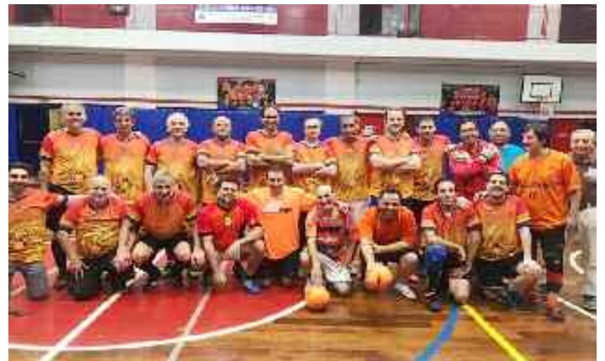
Plantel actual. El grupo está conformado por más de 30 integrantes.

das Mundiales de París 1995, en las Mundiales de Albena 2004 (Bulgaria) invictos y valla invicta y en las Mundiales de Montevideo 2008, a parte se participó de los juegos Panarmenios de 2001, 2003 y 2011, y se participó en las Olimpiadas Mundiales de Australia 1998 y de los últimos juegos mundiales de la UGAB en Los Angeles 2012, se destaca la Triple Corona obtenida