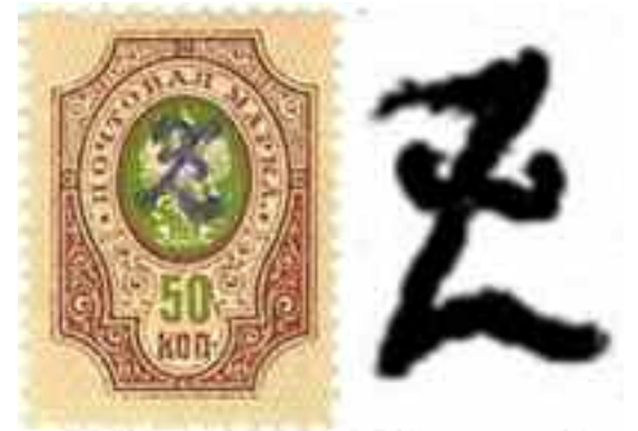
Sello postal ruso resellado con las iniciales ZZ (izq.) y el sello con superposición de las letras ZZ que se parece a la letra latina Z mayúscula cursiva (der.)