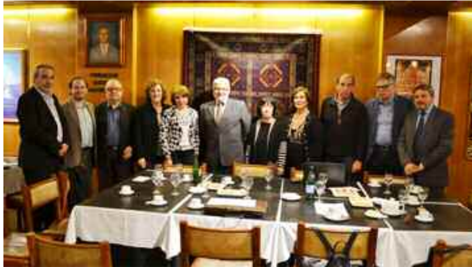
Con representantes de IARA.

claves para la apropiación de la lengua.