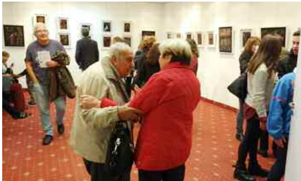
El abrazo entrañable al creador, con numerosos presentes.

Jugando como los niños, encuentro esta forma de expresarme. También, para-