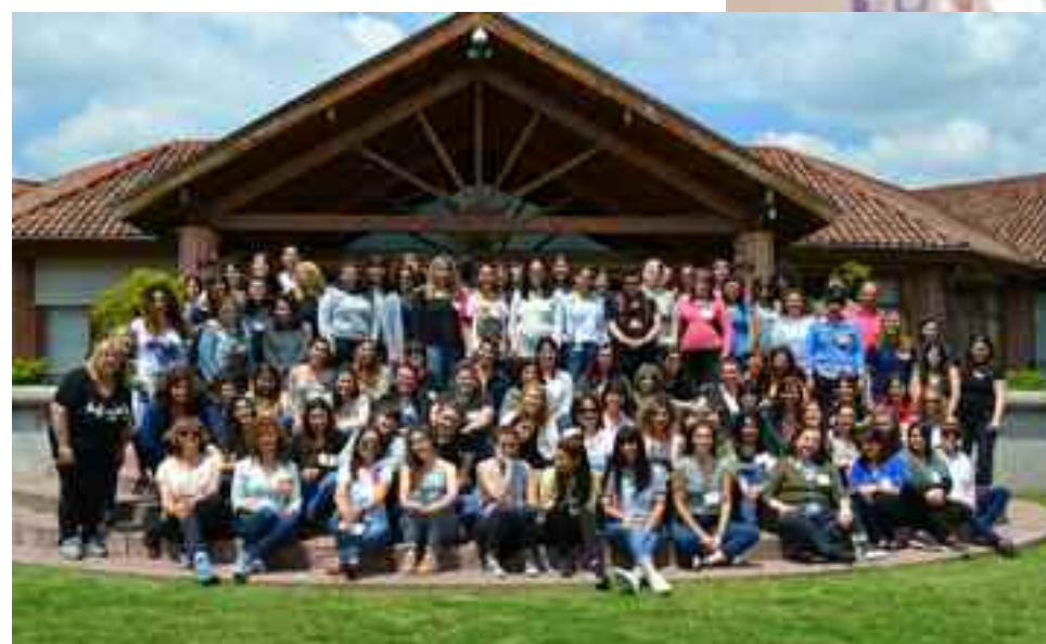
Final del seminario de capacitación en el Club de Campo Armenia.

una posibilidad que no existe en otros países del mundo: la escolaridad comienza a los dos años. En ese año y en el próximo están los momentos