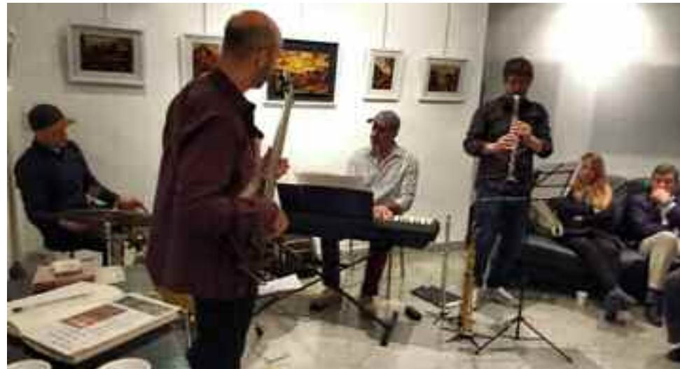
El cuarteto MKQ le puso música a la muestra.