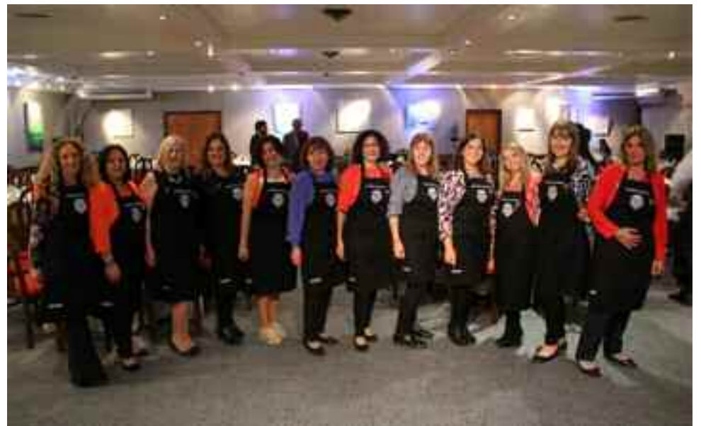
Colaboradoras de la Comisión de Damas.

Damas, un subereg único (las fotos hablan por sí solas), guiso de cebollitas y arroz en pilav, entre otros. Acompañaron la comida unos riquísimos panes armenios y los típicos y deliciosos postres.