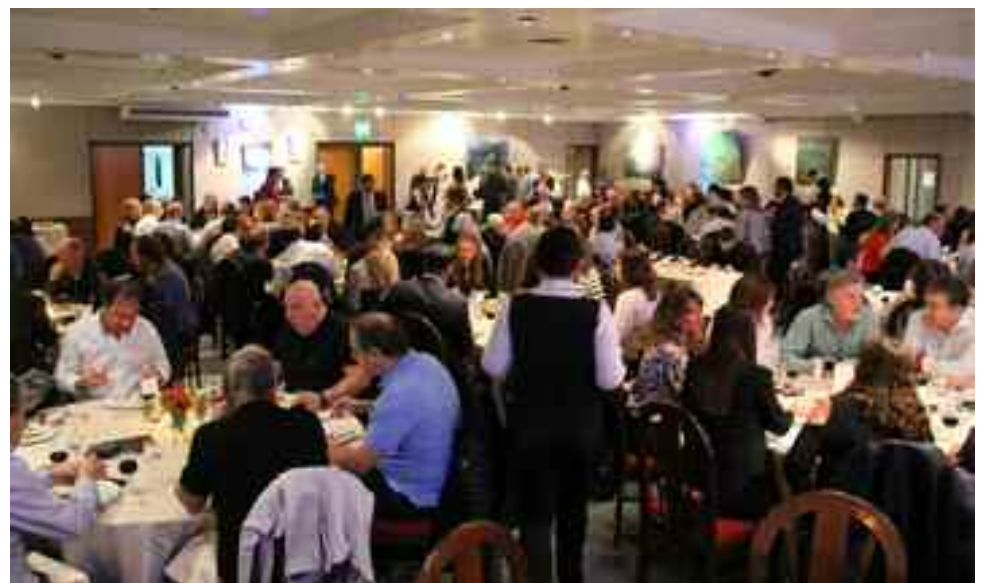
Vista parcial del público presente.