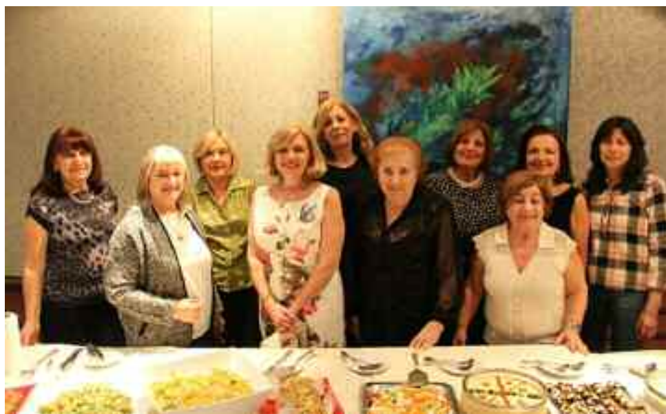
Integrantes de la Comisión de Damas.

mensales. Los platos calientes fueron siete, el aclamado Michov Kufra (esferas de carne con trigo rellenas con nuez) de las