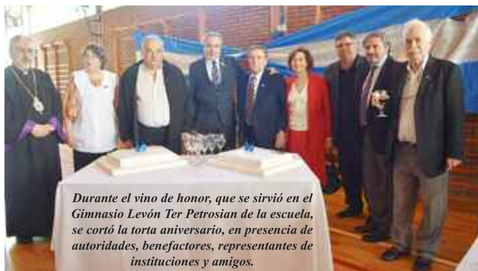
Durante el vino de honor, que se sirvió en el Gimnasio Levón Ter Petrosian de la escuela, se cortó la torta aniversario, en presencia de autoridades, benefactores, representantes de instituciones y amigos.