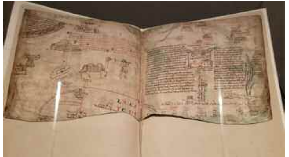
Mapa de Tierra Santa con Armenia. De Chronica Majore, vol.1 Saint Albans, Inglaterra, ca. 1240-53 Iluminado y escrito por Matthew Paris (ca. 1200-1259) Acuarela opaca, tinta sobre pergamino.

Biblioteca Parker, Corpus Christi College, Universidad de Cambridge, Reino Unido (ms. 161)