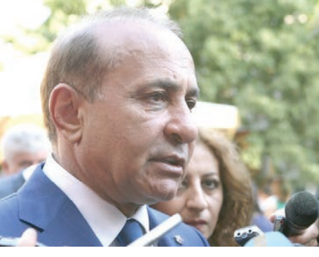
Հայաստանի վարչապետ Յովիկ Աբրահամեան երէկ «անթոյնատրելի եւ դատապարտելի» որակած է այն՝ ինչ որ

տեղի կ'ունենայ Հայաստանի ոստիկանութեան պարեկապահակային ծառայութեան (ՊՊԾ) գունդի տարածքին վրայ: Կառավարութեան նիստի սկիզբը վարչապետը ցանկացած է զոհուած զինուորացիներու վանդակներէն եւ ծառայակից ընկերներէն: