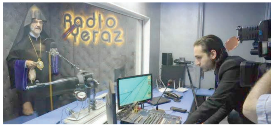
որ «Ռատիո Երագ»-ին ծայրը անխափան մնայ:

Կիրակի՝ 17 Յուլիս 2016-ին, հալէպահայութիւնը մեծ ցնծութիւն մը պարտեցաւ՝ Ներկայ գտնուելով Սուրիոյ հայկական առաջին ռատիոկայանի, 2011 թուականէն ի վեր գործող եւ իր ծայրը համայն աշխարհին հասցնող, «Ռատիո Երագ»-ի կեդրոնի բացման հանդիսաւոր արարողութեան, կը հաղորդէ «Գանձասար»-ը: