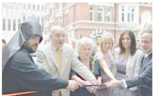
Մեծ Բրիտանիոյ եւ Իրլանտայի թեմի առաջնորդ Յովակիմ Եպիսկոպոս Մսուկեան:

«Մեր գլխաւոր նպատակն է բրիտանահայ համայնքին նոյնիսկ մէկ օրով երկիրի տարբեր ծայրերէն հաւաքել ու համախմբել իրենց ինքնութեան մեր մշակոյթի, պատմութեան շուրջ: Ինծի համար շատ կարեւոր է յատկապէս երիտասարդներու ներգրաւուածութիւնը այս ամէնուն մէջ: Այս տարին մեզի համար առանձնայատուկ է, քանի որ կը նշենք Հայաստանի անկախութեան 25-ամեակը», ըսած է Առաքելական եկեղեցւոյ