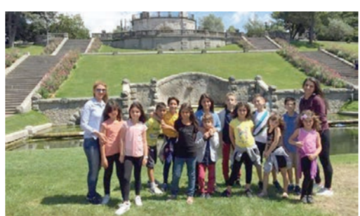
Պատրաստուած է նախապատրաստուած, հայերէնի դասեր, սկարչութիւն, հայկական գեղարուեստ, երգեցողութիւն, խաղեր եւ այլն:

Ծինպաշեան իր խումբին հետ միասին, հիմք ընդունելով նախկին տարիներու փորձը, երկու ամիս Նախապատրաստուած է, որպէսզի երեխաներուն հնարաւորութիւն ընձեռուի սովորելու հայերէն լեզուն եւ հայ մշակոյթը: