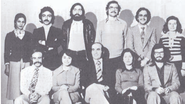
1974 տարեշրջանի ՀԵԸ-ի Համալսարանականներու Վարչութիւն