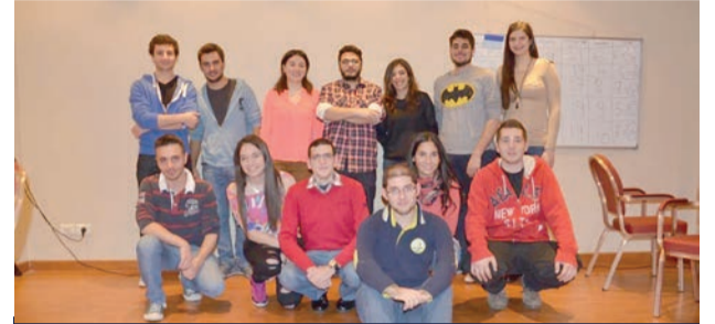
ՀԵԸ-ի Համալսարանական Վարչութիւն, 2014

1940-1944 շրջանին, Միութիւնը բաժնած է իր աշխատանքները տարբեր յանձնախումբերու: Գոյութիւն ունեցած են Սանուց, Գրական, Առողջապահական, Ընկերային, եւ Երաժշտական Յանձնախումբեր[50]: Յետագային, սակայն անոնցմէ մնացած են մշակութային, մարզական եւ ընկերային ենթայանձնախումբերը[51]: Այսօր գոյութիւն ունի այս յանձնախումբերէն ոչ մէկը: Ընդհանրապէս Վարչութիւնը իր ամբողջութեամբ կը կազմակերպէ