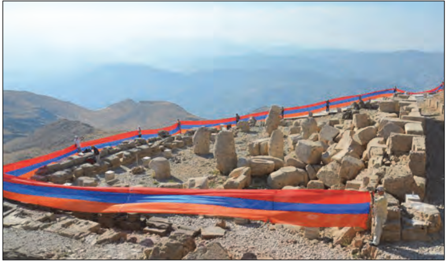
Օգոստոս 12ին հնագույն հայկական Ամանորի տոնի՝ Նաւ սարդի առիթով (Օգոստոս 11), Հայոց Ցեղասպանության խորհուրդը կրող եռագույնը ծածկանեցաւ նաեւ՝ Նեմրուք լեռան

Հայոց Ցեղասպանության խորհուրդը կրող 100 մեթր երկարություն ունեցող եռագույն ծածկանաձև է Նեմրուքի բարձունքին՝ հին հայկական սրբավայրի մեջ: Այս մասին կը յայտնե «Հայերն Այսօր»-ը: