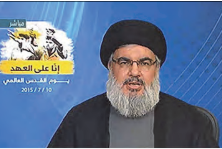
Միշէլ Աունին: Ան սակայն Նշեց, որ իրենց գուցէ որոշ մանրամասնութիւններու պարագային յատուկ դիրքորոշումներ եւ կեցուածքներ պիտի որդեգրեն: Ֆրէնժիէ մերժեց ապակերտուեցման ծրագիրը եւ զօրակցութիւն յայտնեց միացեալ Լիբանանին:

Երէկ առաւօտեան, արտաքին գործոց նախարար Ժըպարան Պասիլ տուաւ մամլոյ ասուլիս մը, որուն ընթացքին Նշեց, որ կառավարութեան նիստին ընթացքին տեղի ունեցածը իրենց կողմէ կանխամտածուած քայլ մըն էր, որպէսզի լրատուամիջոցներուն առջեւ դիրքորոշում մը որդեգրուի եւ պատգամ մը փոխանցուի: Միւս կողմէ հանդարտութեան կոչերը բազմացան, մինչ Նարայիլ վրայ հասաւ խրատներու փաթեթով մը: Ան միաժամանակ զօրակցութիւն յայտնեց Աունին եւ կոչ ուղղեց երկխոսութեան եւ ըսաւ, որ բոլոր ընտրանքները կը մնան բաց: Յիշելու է, որ իրենց կը կանգնին Երեսօրէնի Միշէլ Աունի դիրքորոշումներուն կողքին: Նարայիլի համաձայն Աունի պահանջները արդարացի են: Ան կոչ ուղղեց երկխոսութեան կատարելու Ազգային Ազատ Հոսանքին եւ Մուսաբալայի հոսանքին հետ լուծումներու հանգելու համար: Նարայիլ շեշտեց, որ կառավարութեան մէջ պէտք է մշակուի որոշումներ առնելու արդար մեթոտ մը: